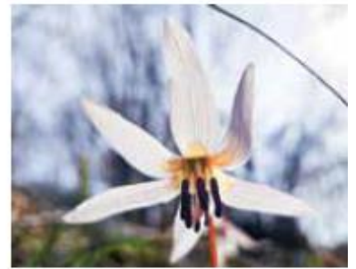
DENTE DI CANE

Il secondo giorno parto da sola alla volta del Monte San Bartolomeo , anche oggi percorro un tratto della Bassa Via del Garda – BVG – e qui ho modo di ammirare la bellezza del golfo di Salò dall'alto, le chiesette caratteristiche degli antichi borghi e una cascata proprio alle spalle di uno di questi santuari. Parcheggio la mia auto a Salò in via San Bartolomeo, e parto seguendo il sentiero n. 217 intorno alle 10.00.