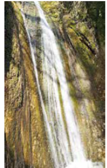
LA CASCATA DEL FIUME RIO

Splendida giornata anche oggi, torno a casa entusiasta con un bagaglio ricco di momenti felici, piacevoli emozioni e nuovi amici conosciuti.